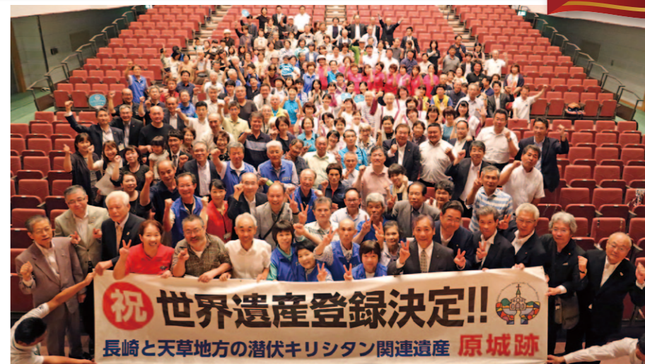
パブリックビューイングでの集合写真

6月24日から7月4日まで、中東バーレーンで開催された第42回ユネスコ世界遺産委員会において、原城跡を構成資産に含む「長崎と天草地方の潜伏キリシタン関連遺産」の、世界遺産一覧表への記載が決定されました。