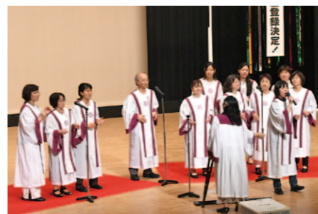
ゴスペルでお祝い