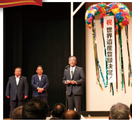
市長の喜びのあいさつ