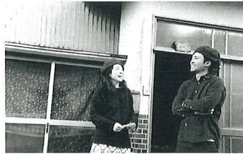
移住後起業している先輩移住者