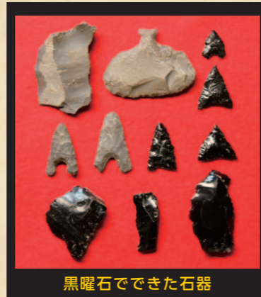
黒曜石でできた石器

黒曜石の小さなかけらが、数千年も前に縄文人が作り上げた広い交易網の様子を物語ります。