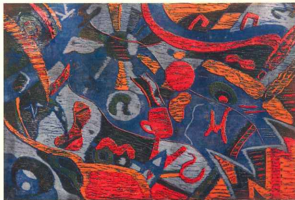
第2部門(中学生の部) セミナリヨ大賞