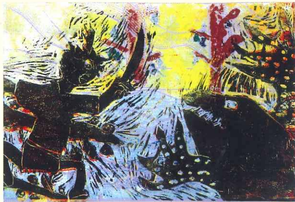
第1部門(小学生の部) セミナリヨ大賞