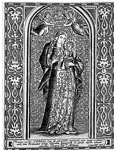
「セビアの聖母」(復刻版)

南島原市は、このような日本の歴史に さんぜん 燦然と輝くまちの歴史遺産を誇りとし、先人の国際性と向学心を鑑にして「歴史と文化のあふれるまちづくり」を目指し「南島原市セミナリヨ現代版画展」を開催します。