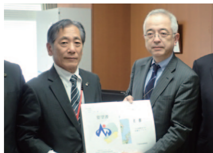
要望活動の様子（国土交通省大臣官房長：右）

市民の皆さんの日常生活における移動の利便性と安全性を確保するためには市道はもちろんのこと、県道や国道の整備も必要不可欠です。市では国や県に対して毎年、早期着工、早期実現に向け要望活動を行っています。また、各種会議などでも要望を行っています。本年度中に入ってからからの主な要望活動は以下のとおりです。