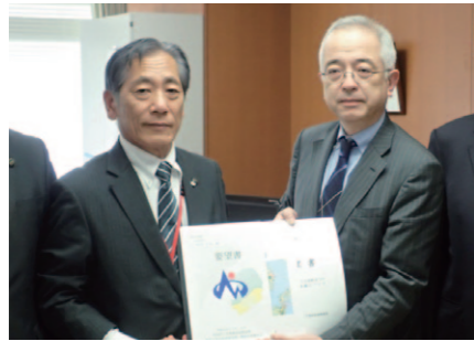
要望活動の様子（国土交通省大臣官房長：右）

市民の皆さんの日常生活における移動の利便性と安全性を確保するためには市道はもちろんのこと、県道や国道の整備も必要不可欠です。市では国や県に対して毎年、早期着工、早期実現に向け要望活動を行っています。また、各種会議などでも要望を行っています。本年度中に入ってからからの主な要望活動は以下のとおりです。