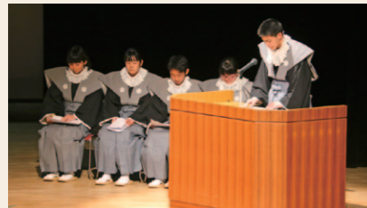
令和遣欧少年使節団によるイタリア派遣報告