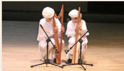
北有馬町聖歌隊コルス・アンジェリクスによる400年前の西洋音楽を再現