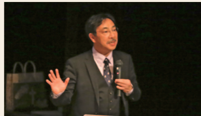
テレビでおなじみの城郭考古学者千田嘉博氏による基調講演