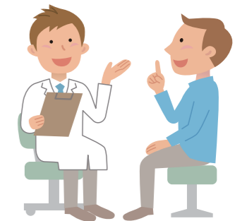
風しん 厚生労働省 検索

昭和47年4月2日から昭和54年4月1日の間に生まれた男性には、クーポン券を令和元年5月末に郵送しています。それ以外の人やクーポン券を紛失された場合は、各支所・市民サービス課で交付申請手続きをしてください。