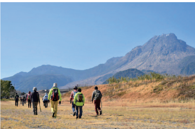
九州オルレ島原コースは、10.5kmの距離を、4時間ほどでゆっくりめぐれるコースです。海、山、まちの風景を楽しむことができます。