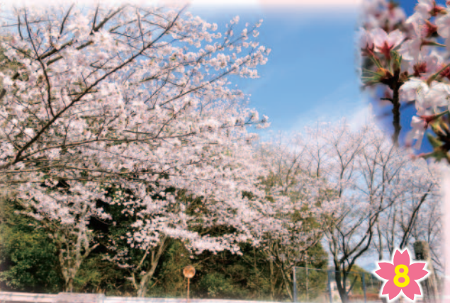
8 旧口之津第二小学校