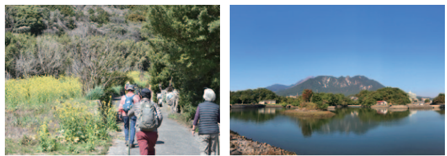
山間ルート 秩父が浦公園