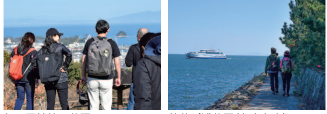
仁田団地第一公園 秩父が浦公園(九十九島)

「オルレ」とは、「通りから家に通じる狭い路地」という意味の、韓国・済州島の方言で、済州島には、地域の自然をそのまま活用し、地域の人々との交流を楽しみながら歩く「オルレコース」と呼ばれるトレッキングコースが26コースあります。この姉妹版が「九州オルレ」で、南島原コースなど22コースがあります。