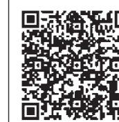
QRコード「とりよせくん」