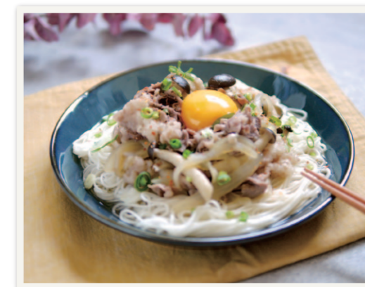
※めんつゆは、お好みで量を調整してください。