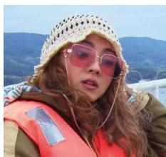
世界一運が悪い 占い師