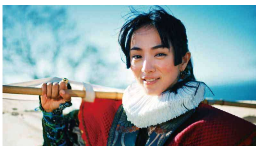
「天草四郎出演と原城跡」篇