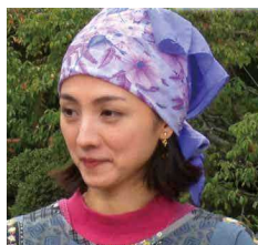
島原手延そうめん 名人の奥様