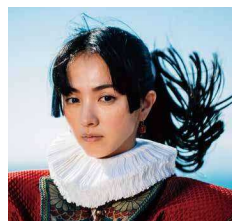
島原・天草一揆の総大将 天草四郎