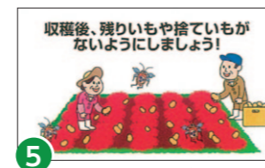
5 畑に残ったジャガイモを拾う