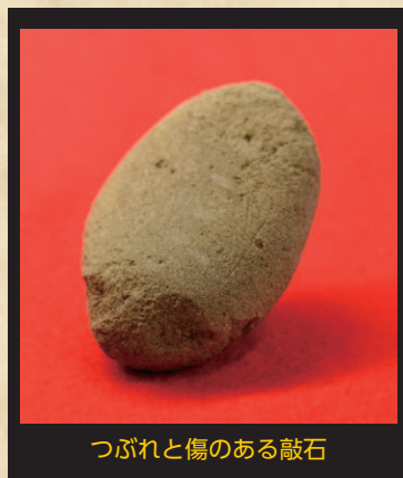
つぶれと傷のある敲石