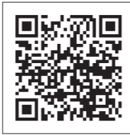
QRコード 日本年金機構HP

☑日本年金機構 諫早年金事務所 ☎0957-25-1662 南島原市 健康づくり課 ☎73-6641または各支所