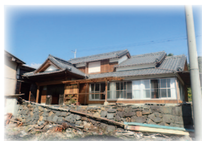
圖 地域づくり課(西有家庁舎) ☎73-6631 FAX82-3086 Eメール: teijyu@city.minamishimabara.lg.jp

市では、定住促進のため、空き家の有効活用を図る「空き家バンク制度」を実施しています。