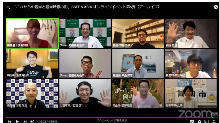
写真は2020年8月20日に行われた「これからの観光と観光映像の形」の様子