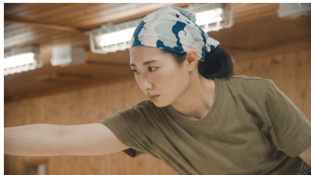
『ふるさとのおい』(佐賀県上峰町)