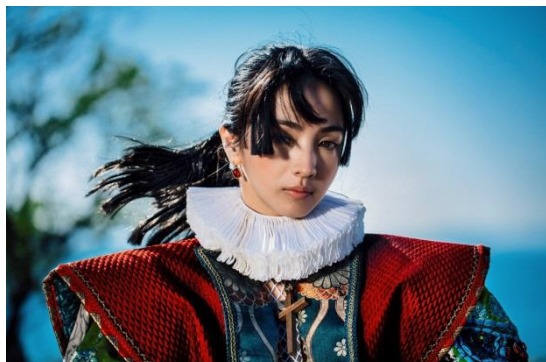
『突撃！南島原情報局【神回】』(長崎県南島原市)

第10回目となる今回は、全国65本の観光プロモーション映像の中から選考を行い、「地域をブランディングする」5本の映像作品をファイナリストとして発表いたしました。