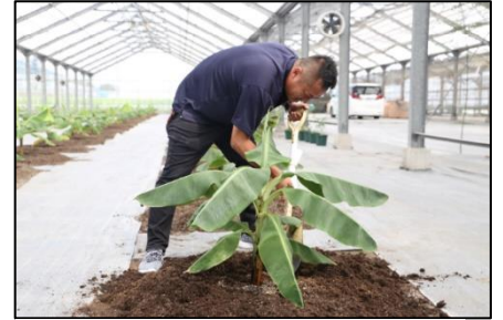
（令和2年9月の植栽風景）