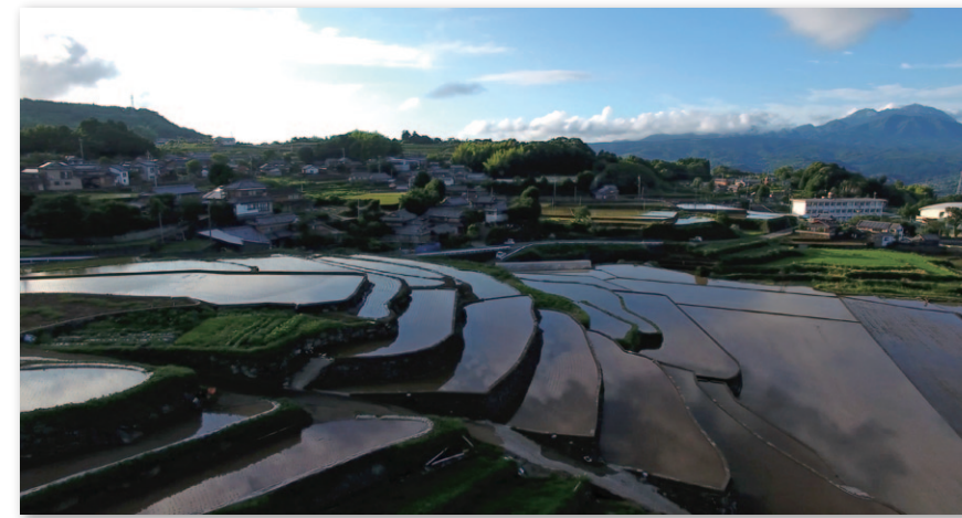
谷水棚田(南有馬町)