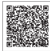
おいしい南島原ブランド認定商品一覧

補助金の申請書類、おいしい南島原ブランド認定商品は市ホームページでご確認ください。