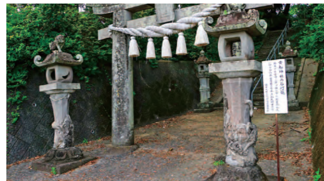
貴船神社の入口の灯籠とその側面に彫られた龍

南島原市南有馬町吉川の国道251号線沿いにある貴船神社は、1637年に勃発した「島原・天草一揆」の際に焼き払われた後、1711年に再建されたといわれている神社です。この神社には、水を司る神様である「タカオカミノカミ」が祀られています。吉川地区には大きな川がなく、平地も少ないことから、安定した水の確保が困難でした。そのため、雨が必要なときには雨を降らせ、雨が降りすぎたときには雨を止める力を持つ神様を祀ったのではないかと考えられています。