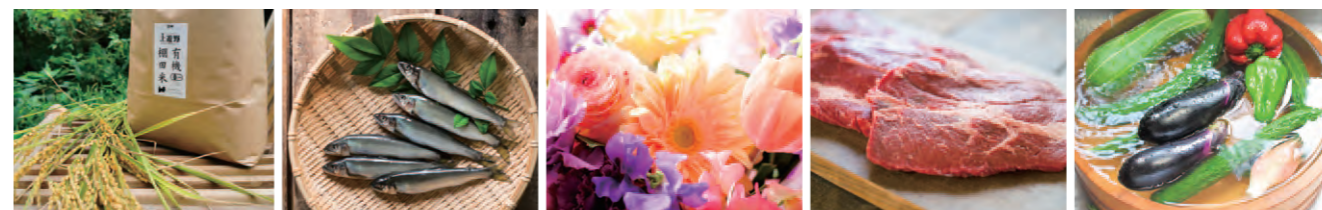
掲載画像は出店商品の一例です。