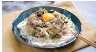
※料理教室は、令和4年2月にかけて実施する予定です。