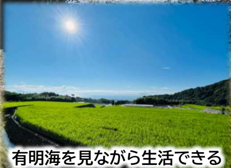
有明海を見ながら生活できる