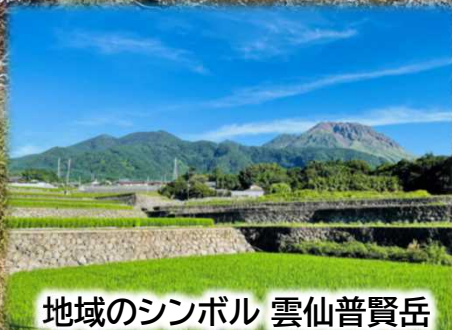
地域のシンボル 雲仙普賢岳