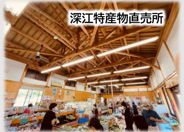
深江特産物直売所