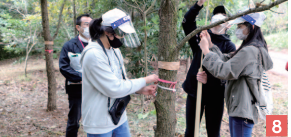
幹回りを測定する南有馬小児童