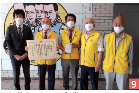
日野江城ライオンズクラブの皆さん