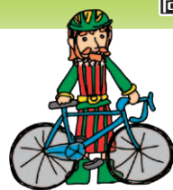
図 建設課(有家庁舎) ☎73-6675