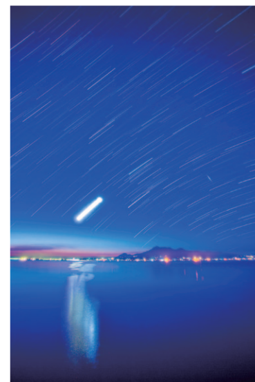
冬の有明海と雲仙と星空

「注文の多い料理店」、「雨ニモマケズ」、「銀河鉄道の夜」。どれも読んだことがあるか、あるいは題名を知っている作品だと思います。