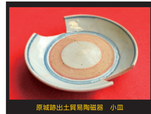
原城跡出土貿易陶磁器 小皿

ろくろの上で回転している焼物に鉋をあてがい、輪状に釉薬を剥ぎ取ることで、上に焼物を重ねても底がくっつきません。見た目は少し悪くなるものの、大量生産が可能になったのです。