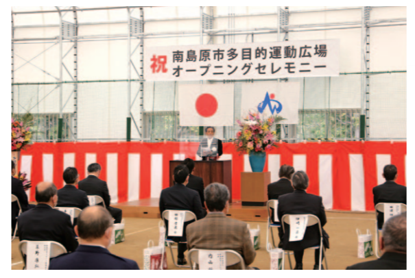
オープニングセレモニー

平成19年3月に惜しまれつつ閉校となった県立有馬商業高等学校跡地を活用して、令和3年1月から工事に着手していた多目的運動広場の建設工事が令和4年2月に完成。3月20日、工事関係者ら出席のもとオープニングセレモニーを執り行いました。