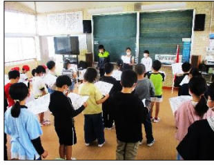
結団式の後、早速、応援練習！

一回目は「開会式の隊形」を覚え、二回目は「赤白の結団式」を行いました。二回の練習の様子を見てみると、リーダーの六年生の動きがよく、締りのあるいい雰囲気を感じられます。