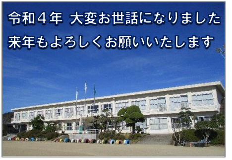
令和4年 大変お世話になりました 来年もよろしくお願いたします

「野田小学校だより」24号年は、新しいことに挑戦するのに最適な年だとも言われます。新たに目標を掲げて、達成を目指すのもいいでしょう。どうぞ、よいお年をお迎えください。