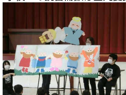
チューリップの会のペープサート