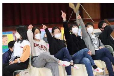
4年生の最後は感謝の言葉 5年生は6年生クイズや進行を取り仕切りました 6年生のダンス