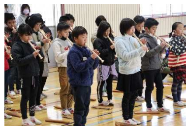
1年生のかわいいダンス 2年生はプレゼントを渡しました 3年生はリコーダーで「歓びの歌」を演奏