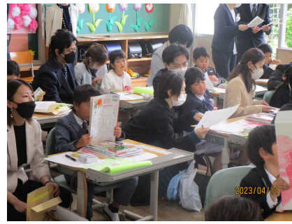
< 新しい教科書を目の当たりにして >

これで、全校児童206名そろってのスタートが切れました。さっそく6年生は、入学式翌日から、登校後、身の回りの世話や話し相手をして最上級生として励んでいます。また、1年生が少しでも早く学校に慣れるよう、遊びの計画も立てているようです。こういったよき姿を伝統としてつなげていきたいものです。