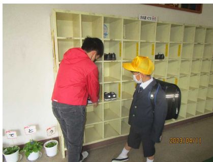
< くつ箱を教える様子から >