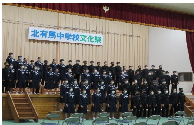
全校生徒による合唱