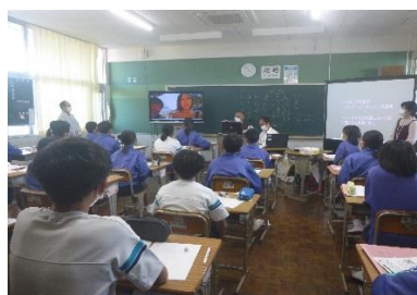
教室にいてポルトガルとつながる