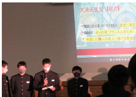
2年生修学旅行の発表