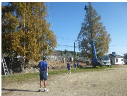
熱心に取り組む生徒たち

10月29日（土）、有馬小学校のツリーに、イルミネーションの取り付けを行いました。当日は、男女ソフトテニス部の生徒たちが、取り付けを手伝ってくれました。高さ30メートル近い2本の木に、高所作業車を使って取り付ける作業は、3時間以上かかりましたが、生徒たちは最後まで熱心に作業してくれました。