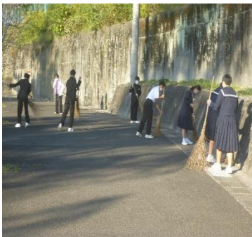
朝の清掃活動の様子