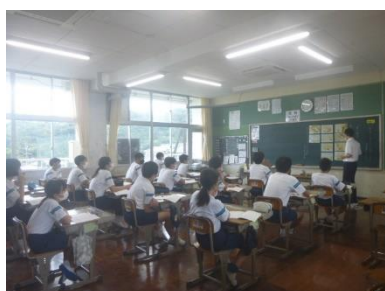
3年生の授業の様子

また、この日は、授業参観と学年学級 PTA を開催し、命に関することや SNS の問題などを取り上げました。1学期の様子や夏季休業中のこと、2学期の行事等についても話をしました。お忙しい中、多くの皆様に御来校いただき、ありがとうございました。