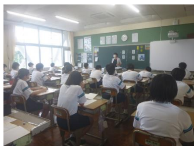
1年生の授業の様子