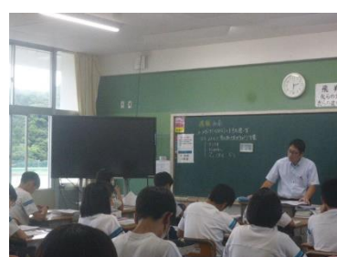
2年生の授業の様子