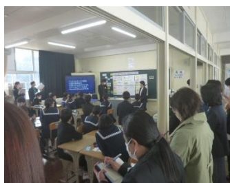
県内各地の先生方が参観