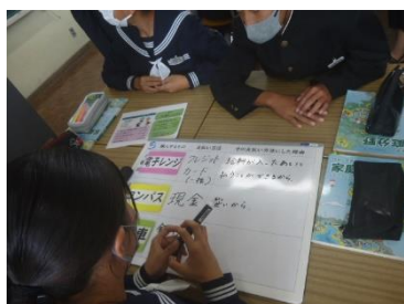
何をどんな方法で購入？