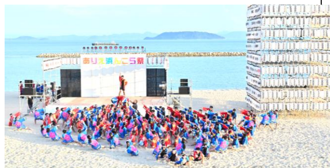
<見事！有中ソーラン節！よく頑張りました>

去る8月17日に地域行事である「ありえ浜んこら祭」が開催され、本校生徒も、吹奏楽の演奏とソーラン節の演舞で参加しました。ソーラン節は、5月の体育大会以来の演舞で、1学期末と前日の練習、当日のリハーサルの3回だけの練習でしたが、本番では酷暑の中、具合が悪くなる生徒もなく、一生懸命に踊っていました。その一生懸命に踊る姿は、感動的であり、さすが有中生でした。できる生徒達でした。