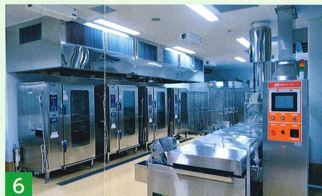
6 揚物・焼物・蒸物室