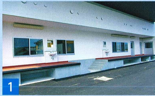
1 荷受室側プラットホーム