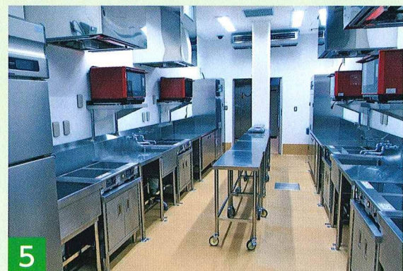
5 アレルギー食調理室