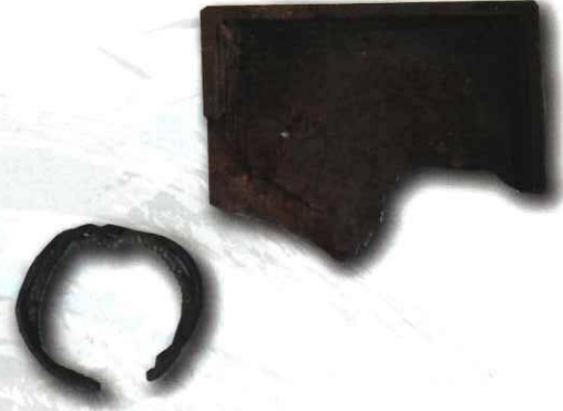
「硯片」南島原市教育委員会所蔵

島原・天草一揆後、日本は鎖国し、禁教の時代が続く。出島や信徒発見に関わる資料から禁教と文明開化のリアルを紹介します。