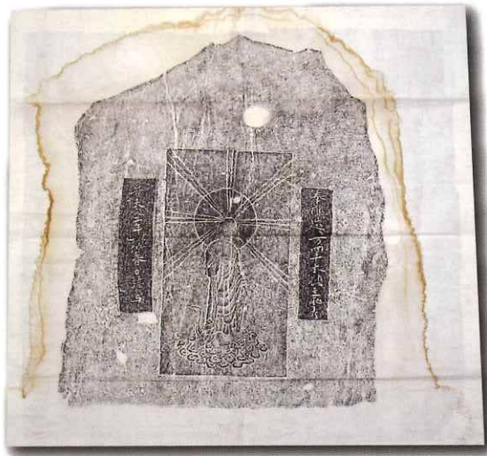
「阿弥陀如来来迎図」個人蔵

本特別展では、現在まで残された石仏、島原・天草一揆の遺物や一揆後に記された数多くの原城の絵図から有馬領内と島原・天草一揆のRealを紹介します。