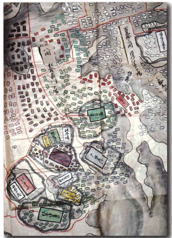
「肥前島原城攻之図」個人蔵

本特別展では、現在まで残された石仏、島原・天草一揆の遺物や一揆後に記された数多くの原城の絵図から有馬領内と島原・天草一揆のRealを紹介します。