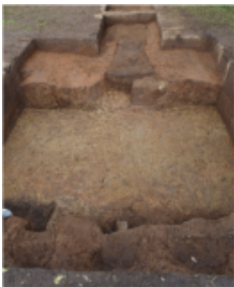
一揆勢の籠城施設(竖穴)