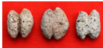
一揆勢が使用した石錘(せきすい) ※ 漁労具(引き網用のオモリ)