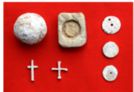
原城内(一揆時)の信心具製作・金属加工に関する遺物